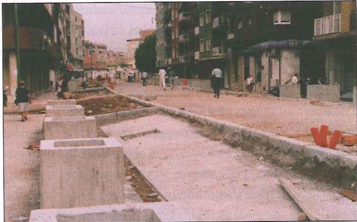
Las jardineras son el elemento que caracteriza la rambla Nova.

Este otoño quedarán acabadas las obras de la Rambla con la urbanización de la rambla Nova. El derribo de un almacén en Quatre Cantons ha permitido finalizar el tramo de la rambla de Fiveller e incorporar una zona ajardinada.