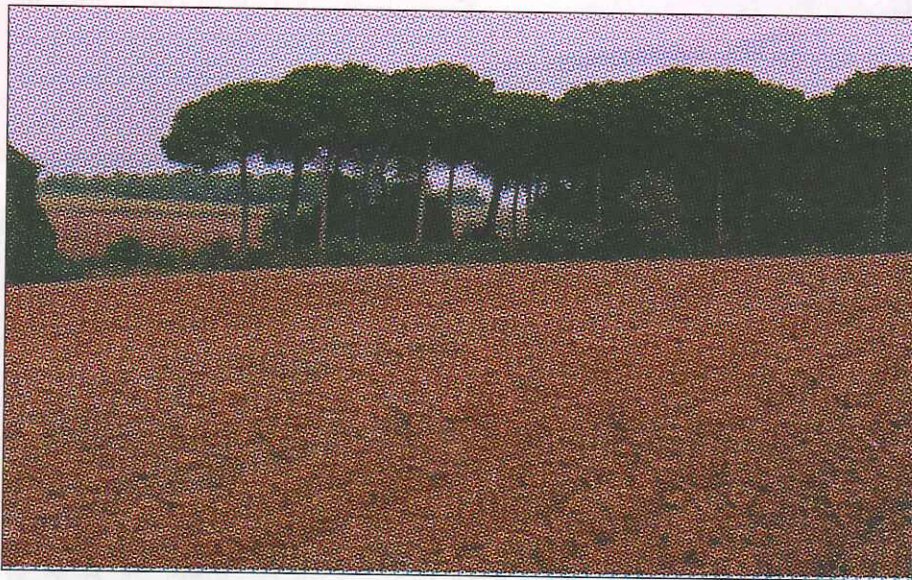
Conreus, boscos i masies formen el paisatge de Gallecs.

col·lectius interessats en la conservació de Gallecs, és la proposta que fa l'Ajunta- ment, però la seva aplicació dependrà de l'interès de la Generalitat, que és la pro- pietària dels terrenys. El treball proposa algunes actuacions singulars, com la