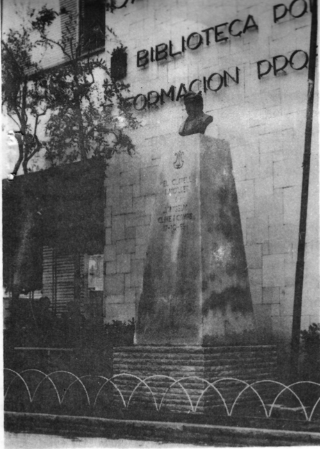
Monument al mestre A. Clavé situat al jardinet del Casal Cultural.