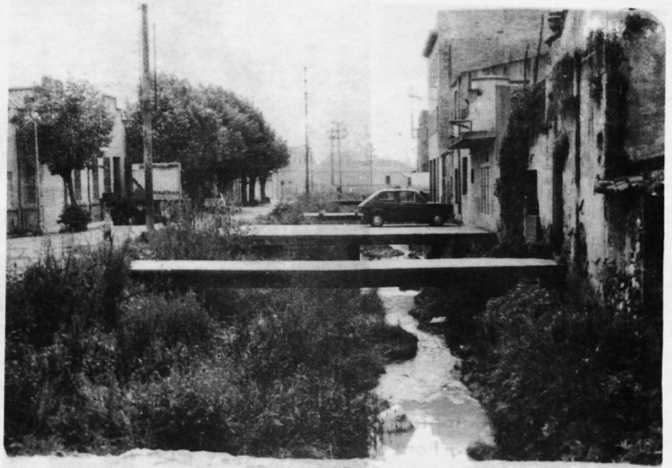
Torrente Caganell per cobrir. Carrer Balmes.