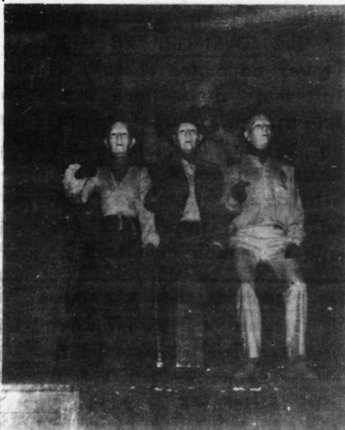
Actuació del Grup de Teatre "LA SINIA" a Can Gomà